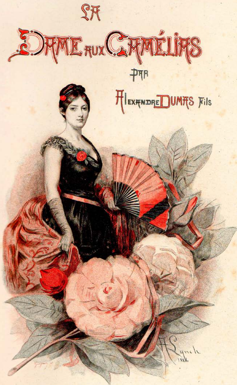
La Dame aux Camélias, 19de-eeuwse illustratie van Albert Lynch bij La Dame aux Camélias van Alexandre Dumas Fils, Paris, Maison Quantin, s.a. [1886]

In de 18de en de 19de eeuw gingen vooral Engelse en Nederlandse botanici tijdens grote ontdekkingsreizen op zoek naar uitheemse planten. De Engelsen haalden in de 18de eeuw de eerste variëteiten van de camelia uit China. Aanvankelijk gebeurde dat in de veronderstelling dat het theeplanten waren en dat men op die manier zelf de toen ontzettend dure thee zou kunnen kweken. Snel zag men de