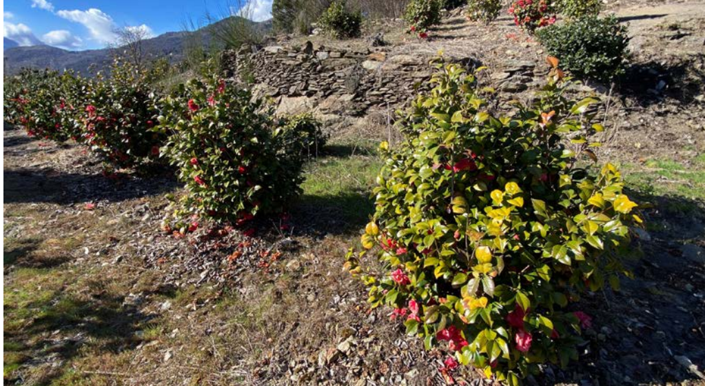
De bloeiende Camellia Duc d’Ursel in de kwekerij Savioli aan het Lago Maggiore