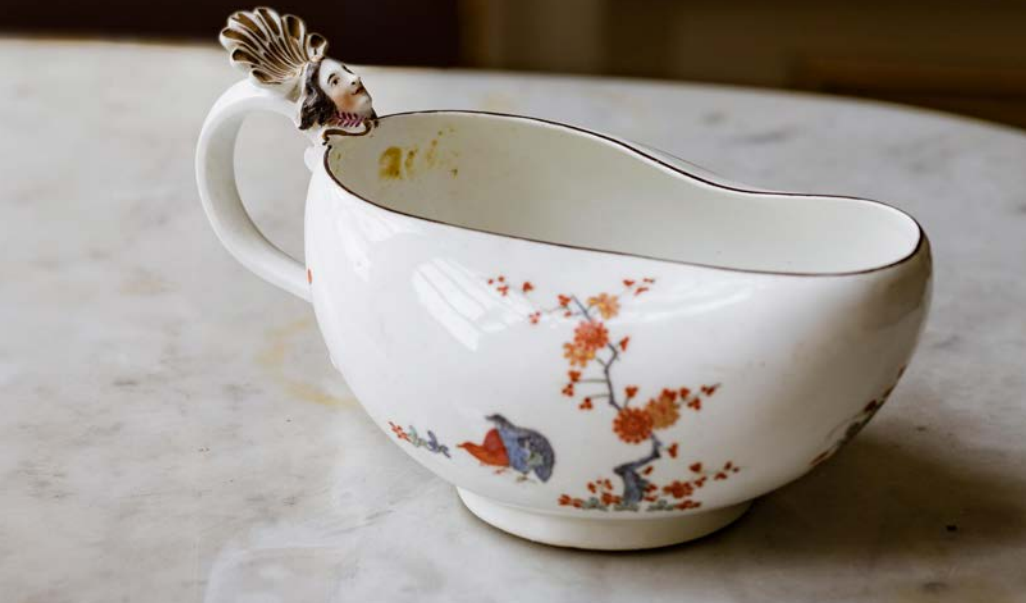
Bourdalou uit de collectie van de hertog d'Ursel