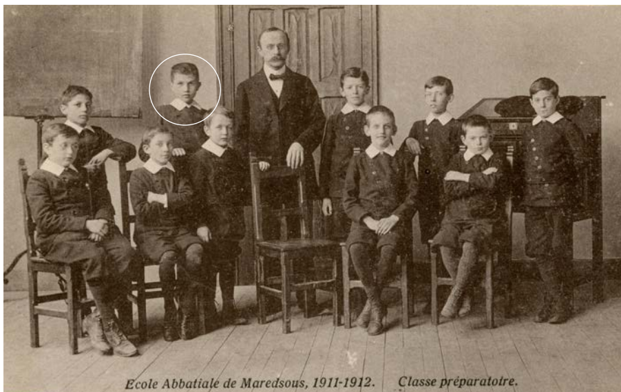
Ecole Abbati le de Maredsous, 1911-1912. Classe pr paratoire.