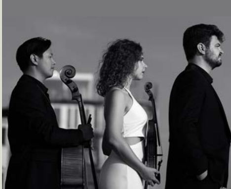
Susato Trio

CC Ter Dilft | 03 890 69 30 | www.terdilft.be