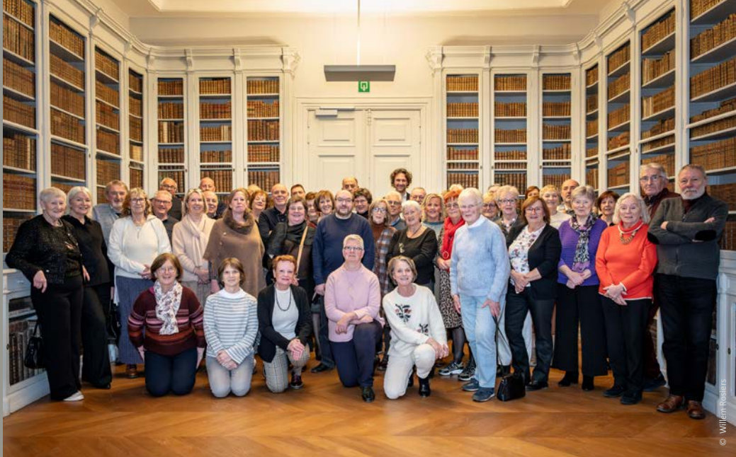
De kasteelvrijwilligers tijdens het vrijwilligersfeest op 5 december 2024

‘Toen we het kasteel contacteerden, bleek dat er nog maar één bank beschikbaar was: die aan het einde (of het begin) van de platanendreef. Dat kwam eigenlijk heel goed uit, want mijn moeder vond dat een ideale bank om nog even te zitten voordat ze terug naar huis ging. Bovendien heb je er een mooi zicht op de grote walgracht. Vaak zitten de eendjes daar en in de zomer kan je er de grote karpers met hun rug boven water zien komen. De spreuk op het plaatje verwijst naar het kinderspel dat oma haar achterkleinkinderen aanleerde. Het is fysiek eenvoudig, dus dat kon ze nog meedoen. Tegelijk hebben we haar naam – Anette – een beetje aangepast zodat hij beter past bij het kasteel ( licht ). Uiteraard hebben we het spel ook nog gespeeld tijdens de inhuldiging van de herinneringsbank. Een zesjarige vatte de essentie goed samen, toen hij vroeg of hij dan hier aan oma kon komen denken. Op kerstavond zijn we met de familie aan de bank gaan aperitieven en onze zesjarige heeft toen zijn hapje voor oma achtergelaten. De volgende dag was het weg, ongetwijfeld met hulp van haar geliefde eendjes.’